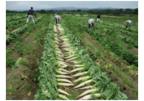
夏大根の収穫作業

7月下旬～8月下旬まで「夏大根」の収穫が五月雨式に行われました。大根は収穫する時期や季節に応じて品種を選びます。夏どり用の大根は暑さに強い大根の品種となりますが今年6月の低温による発芽不良、7月は高温少雨による生理障害による品質低下、日照不足による生育の遅れ…等、天候不順の影響で平年の3割減となる収量になりました。8月下旬の最後の収穫では夏大根らしい大きく瑞々しい大根が収穫され、1日で4.3t(約4,000本)の収穫になりました。9月はニンジンの収穫、稲刈り、下旬からは秋大根の収穫が始まります。