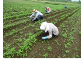
エンジン畑の草取り